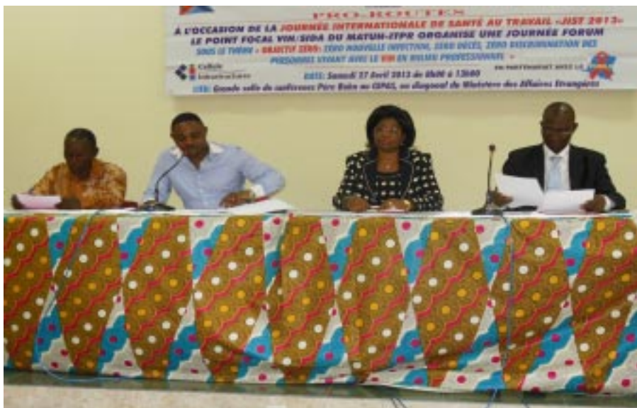
Table des officiels

D ans le cadre de la célébration de la Journée Internationale de la Santé au Travail , une matinée de sensibilisation a été organisée le 27 avril 2013 par le Point Focal VIH/SIDA du Ministère de l'Aménagement du Territoire, Urbanisme, Habitat, Infrastructures, Travaux Publics à l'intention des agents et cadres du Ministère sur les risques et la prévention des maladies professionnelles en milieu professionnel. Un accent particulier a été mis sur la pandémie du SIDA.