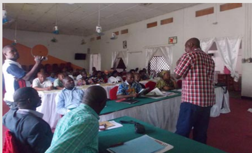
Le Chargé de Communication répondant à une question

La réunion de Kisanagani a connu la participation des associations de Bafwasende et du Bas-Uélé. Après une présentation du projet Pro-Routes en général, et de l'étendue des travaux exécutés et programmés par le projet dans la Province Orientale en particulier, la réunion s'est étendue sur différentes questions soulevées par les associations et organisations de la province en rapport avec le calendrier de travaux, la qualité et la