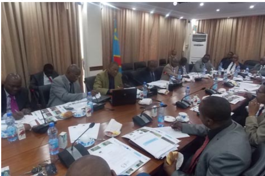
Le Coordonnateur de la CI au cours de son exposé

S ur invitation du Cabinet du Ministre Délégué des Finances auprès du Premier Ministre, le Coordonnateur de la Cellule Infrastructures a fait le lundi 26 août 2013 un exposé sur la situation des projets sous gestion de cette structures du Ministère de l'Aménagement du Territoire, Urbanisme, Habitat, Infrastructures, Travaux Publics et Reconstruction. Ont pris part à cette rencontre présidée par le Directeur de Cabinet, les Conseillers du Ministre, ainsi que des gestionnaires des projets et programmes du secteur des infrastructures routières.