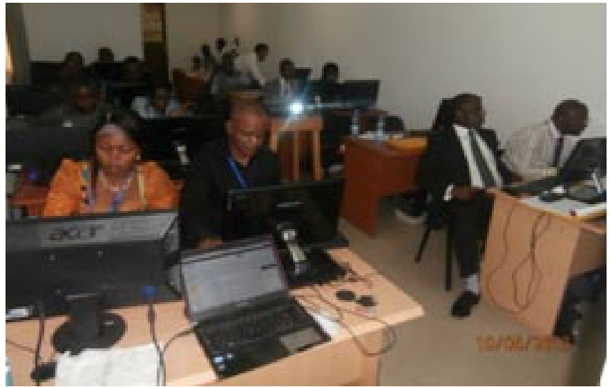
Vue des Agents dans la salle de formation