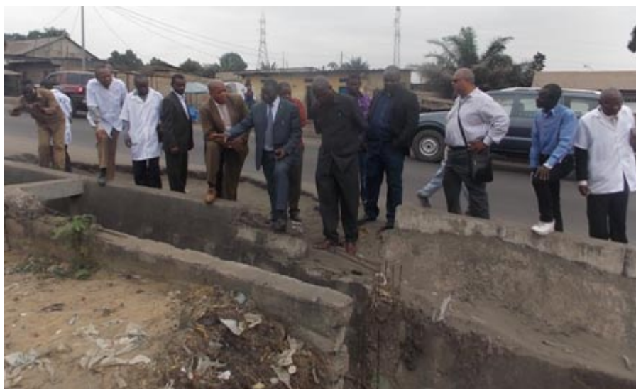
Le Ministre en train d'inspecter les caniveaux

A ccompagné du Directeur de Cabinet Adjoint, du Coordonnateur de la Cellule Infrastructures, des responsables de l'Office des Voiries et Drainage et du DG de l'entreprise AFRITEC, le Ministre de l'Aménagement du Territoire, Urbanisme, Habitat, Infrastructures, Travaux Publics et Reconstruction a effectué le lundi 29 août 2013 une descente sur l'avenue de Libération, précisément sur la section Rond point Moulaert-Hôpital de référence de Makala. La visite était dictée par l'urgence de trouver une solution à la destruction très avancée des caniveaux sur la montée de l'Hôpital de Référence de Makala, entre le marché de Selembao et l'ex-Sanatorium.