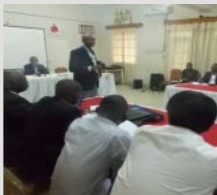
Ouverture de l'Atelier

Une session de formation sur la Gestion Environnementale et Sociale a été organisée du 2 au 5 juillet 2013 au Centre Béthnaie de Kinshasa par l'Unité de Gestion Environnementale et Sociale de la Cellule Infrastructures. Au regard des impacts environnementaux et sociaux dans la zone du projet Pro-Routes, cette session était destinée d'abord aux différentes structures impliquées dans la mise en oeuvre du projet Pro-Routes: Cellule Environnementale et Sociale de l'Office des Routes (CESOR), BEGES, brigades 405, 401 et 602, entreprises privées exécutant les travaux du projet Pro-Routes. Le Ministère de l'Environnement, Conservation de la Nature et Tourisme a pris également part à cette session de formation, à travers le GEEC.