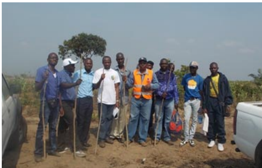
16 septembre 2013: Photo souvenir après la jonction de deux segments identifiés lors de deux précédentes explorations

dical de Kinshasa (IEMK). Point n'est besoin de dire que ces deux projets font actuellement la fierté de la capitale de la RD Congo. La technicité et l'organisation de chantiers des entreprises japonaises tranchent nettement avec ce qu'on a vu jusqu'ici.