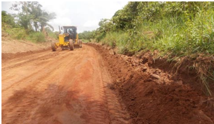
Mise en forme de la plate-forme sur la route Buta-Dulia

Concernant les travaux, la délégation a relevé quelques problèmes qui ont fait l'objet d'échanges et des recommandations lors de la réunion organisée à Buta à l'issue de la visite. Il s'agit, entre autres, de la longue distance qui sépare les ateliers d'ouverture et de rechargement, du non respect, sur certaines sections, de la largeur de la plate-forme exigée par le standard