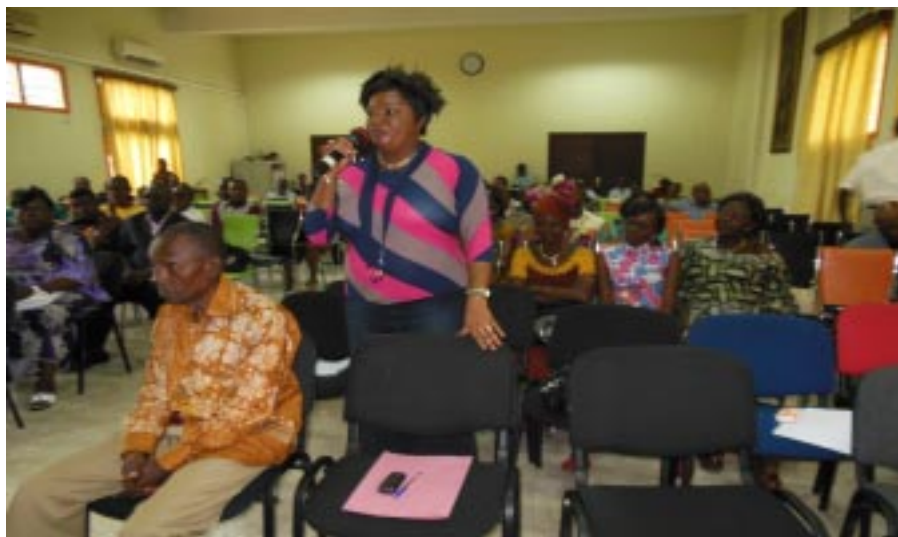
Participants à la matinée de sensibilisation