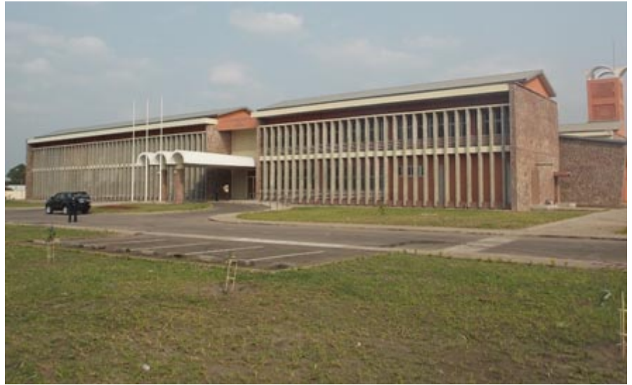
Façade principale du bâtiment administratif et scolaire du Nouveau Complexe de l'IEMK

A u cours de trois derniers mois, le site de l'IEMK a connu une ambiance extraordinaire avec les visites des membres du Gouvernement ainsi que des diplomates et responsables de la Coopération japonaise (JICA). A l'approche de l'échéance annoncée pour l'inauguration du nouveau complexe de l'IEMK, toutes les parties voulaient s'assurer que les travaux étaient bel et bien en voie d'achèvement. Ainsi, on a vu défiler sur site le nouveau Représentant Résident de la JICA, l'Ambassadeur du Japon en RD Congo, les Ministres de santé et des Infrastructures, pour ne citer que ceux-là. Tous sont repartis très satisfaits, apaisés. Finalement, la réception technique a eu lieu, le 29 juillet 2013.