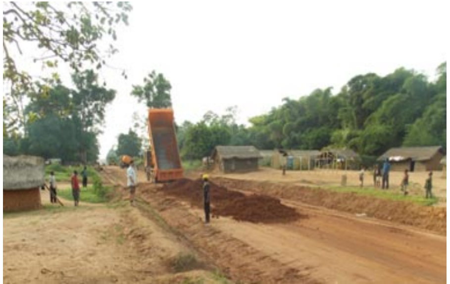
Travaux de rechargement sur la route de Dulia sous le regard du formateur international

Dans la conduite des chantiers pédagogiques, l'approche méthodique reste la même. Les formateurs, dans une première