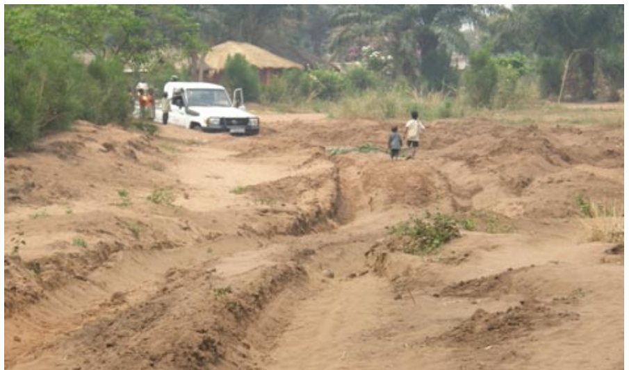
Etat de la route lors de la visite de terrain