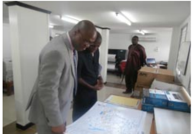
Visite de l'Unité SIG