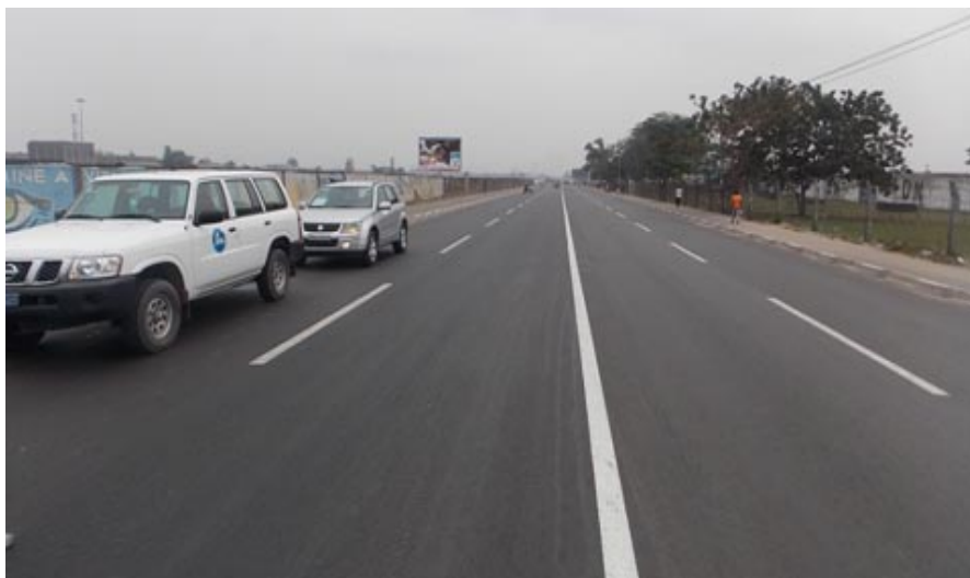
Vue du deuxième tronçon après intervention

Sur les deux tronçons de l'avenue déjà achevés, on déplore cependant des comportements inciviques de la part des populations riveraines qui déversent des immondices dans des caniveaux et surtout des automobilistes qui roulent sur des assainissements, provoquant ainsi des destructions de caniveaux. Une réunion a été organisée à cet sujet par le Ministre Provincial en charge des ITP, avec la participation de la partie japonaise, de la Cellule Infrastructures et des bourgmestres des communes de Limete et de Gombe. B.M.S.