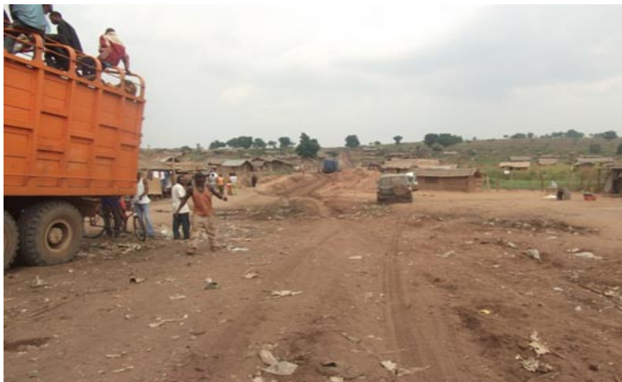
Etat de la route au-delà du pont Loange lors de la mission d'évaluation du projet

Les travaux à exécuter comprennent notamment les terrassements et les modifications du tracé et du profil en long, la réhabilitation et la remise du profil des talus en déblai, l'aménagement des embranchements, l'exécution du corps de chaussée, la mise en oeuvre du revêtement en béton bitumeux, la