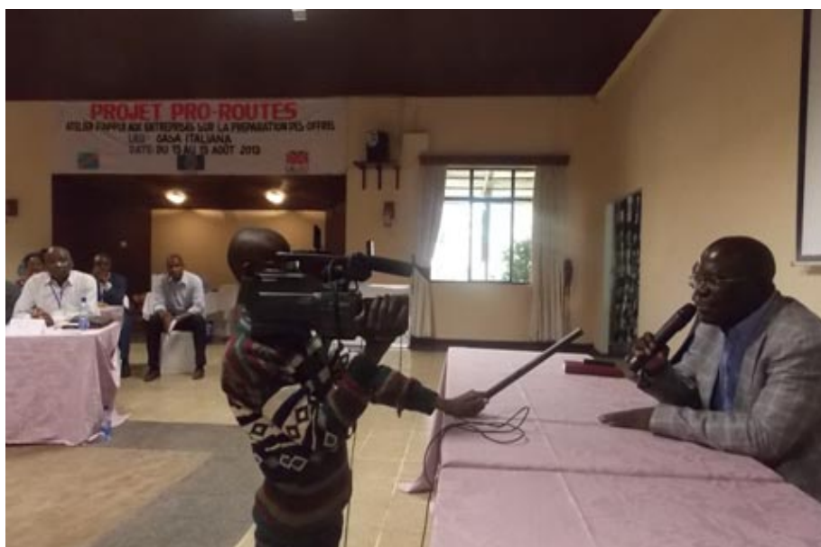
Clôture de l'atelier de Lubumbashi par le Prof. Dikanga Kazadi, Ministre Provincial des TPI

Les ateliers organisés à Kalemie et à Lubumbashi au cours de la première quinzaine du mois d'août 2013 ont clôturé cette première série d'ateliers. B.M.S.