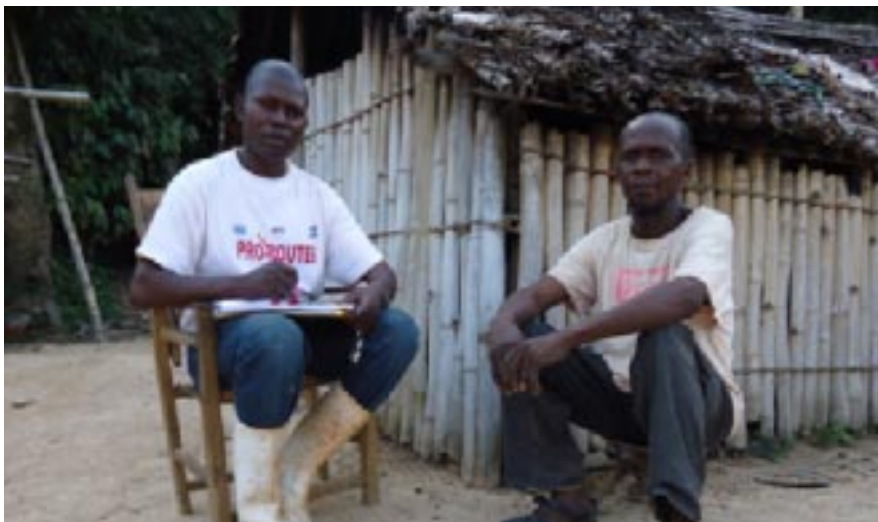
Enquêteur sur la RN 4 à Zambeke

L e Bureau d'Etudes en Gestion Environnementale et Sociale (BEGES) a organisé le mardi 25 juin 2013 au Centre Interdiocésain de Kinshasa un atelier de restitution sur la présentation et la synthèse des résultats de l'Enquête CAP (Connaissance, Attitudes et Pratiques) sur le VIH/SIDA effectuée par l'ONG SAPHIR DEVELOPPEMENT dans le cadre de la mise en oeuvre des mesures environnementales et sociales de la Composante 3 de du projet Pro-Routes.