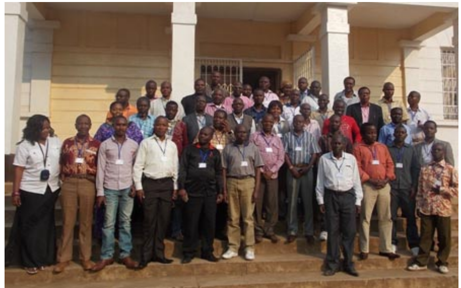
Clôture de l'atelier de Bukavu

L e manque de compétitivité a été considéré souvent comme un des facteurs qui empêchent la promotion et l'épanouissement des PME congolaises du secteur de construction routière. Comment y remédier? Le projet Pro-Routes, dans son programme d'appui au secteur privé, propose des ses-