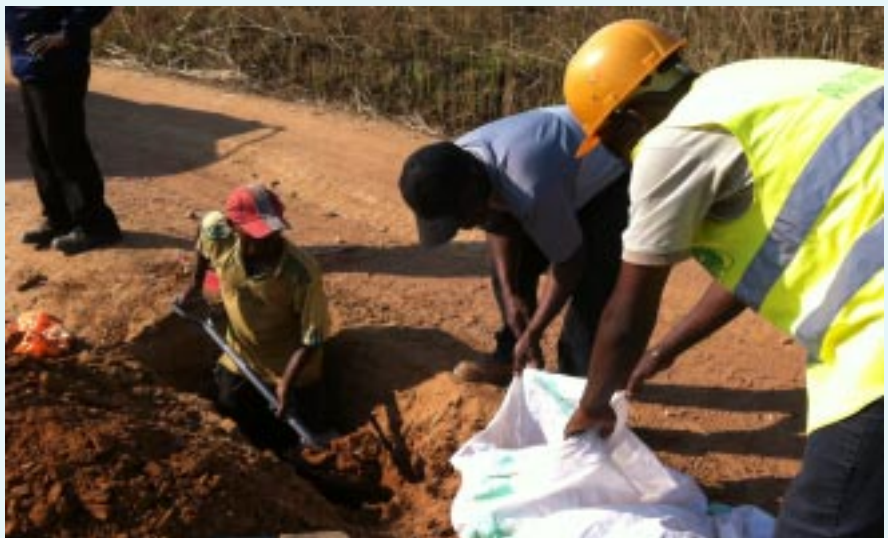
Prélèvement d'échantillons sur la route Kalemie-Uvira

Sur la base du contrat signé en juin 2012 avec Crown Agents for Overseas Governments and Administrations Ltd, l'Office des Routes à travers le LNTP et la Direction des Etudes a été appelé à terminer le reste des essais et à transmettre les résultats à AURECON à mi-août 2013.