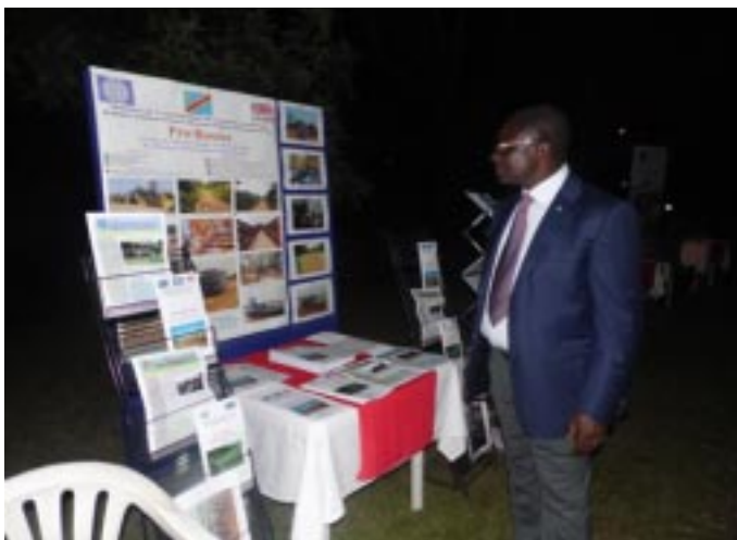
SEM le Ministre de l'ATUH-ITPR visitant le stand de Pro-Routes

A l'occasion de la Fête de la Reine d'Angleterre, Pro-Routes a été invité à participer le samedi 15 juin 2013 à l'exposition organisée dans l'enceinte de l'Ambassade de Grande Bretagne. Rien d'étonnant! Pro-Routes représente le plus gros investissement de la Grande Bretagne dans le secteur routier en RD Congo.